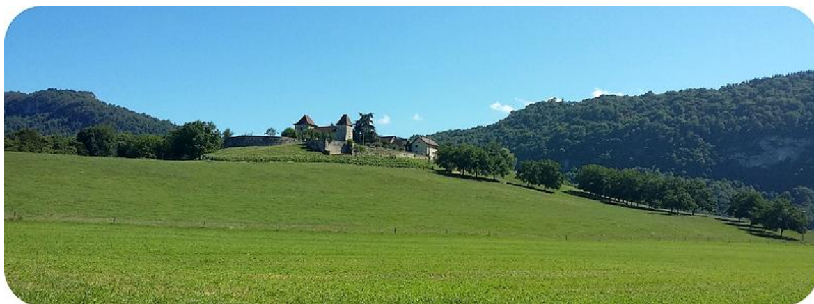
Château de Mandrin à Rochefort