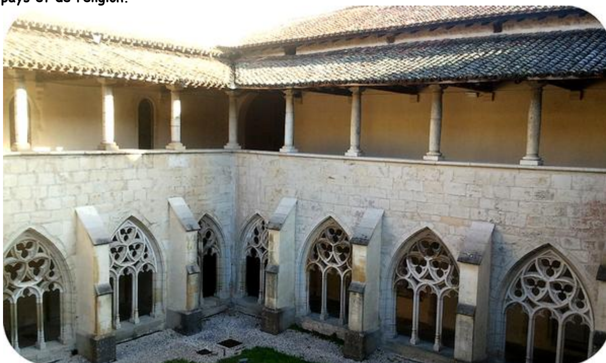
Le cloître et sa galerie supérieure