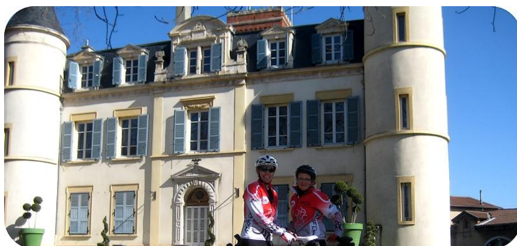
Château de FEYZIN

http://www.openrunner.com/index.php?id=5427369