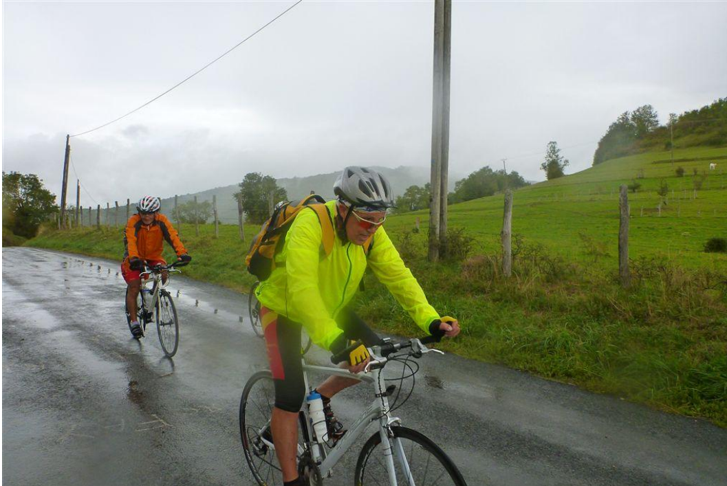
Douche dans le BUGEY