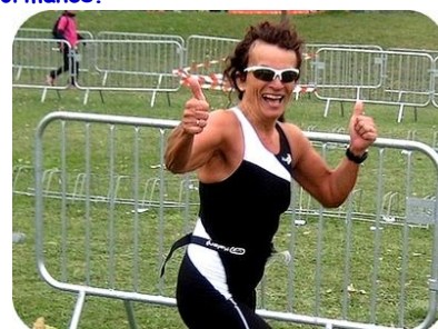
Même pas fatiguée