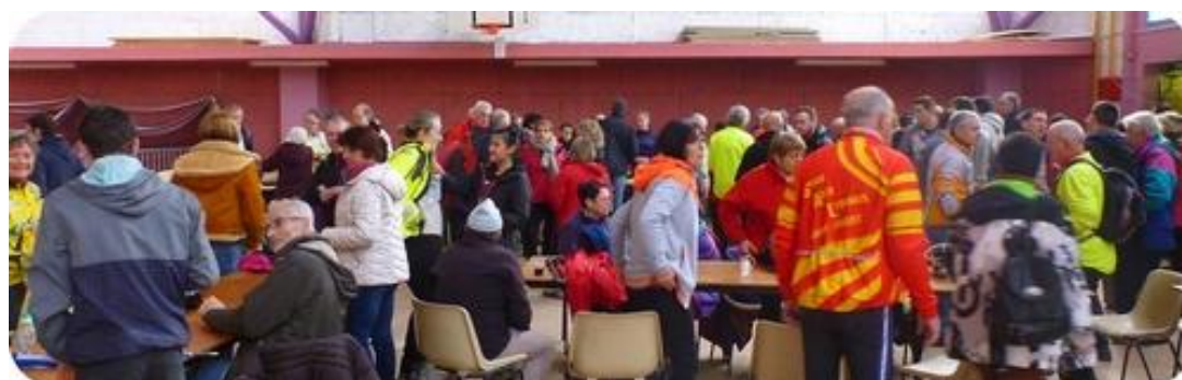
Tous les participants réunis pour la dégustation de crêpes.

A.T.S.C.A.F. : Association Touristique Sportive et Culturelle des Administrations Financières.