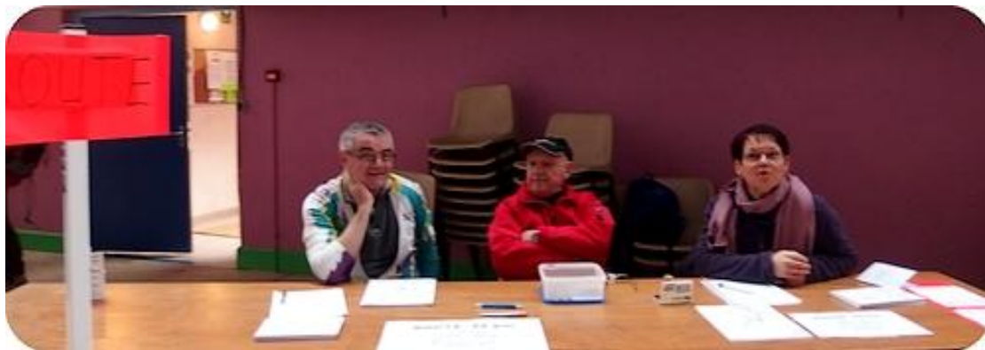
On ne se bouscule pas à la table d'inscription pour la route