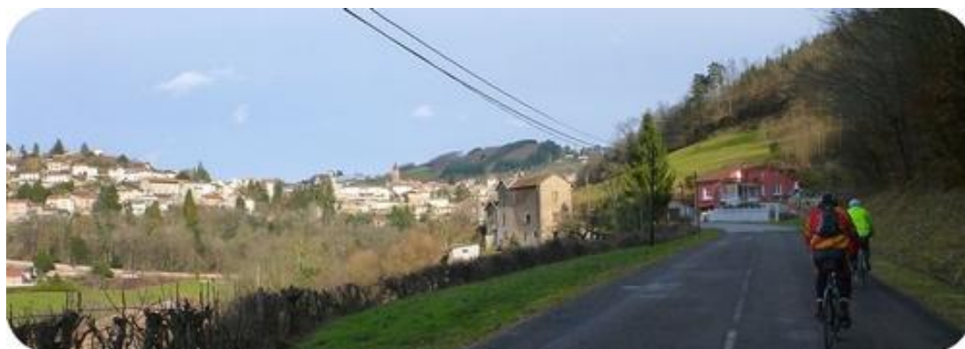
Retour des cyclos sous le ciel bleu !!!!