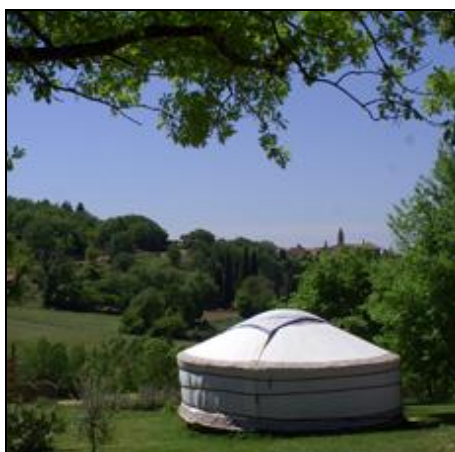
Une yourte à BARJAC

A.T.S.C.A.F. : Association Touristique Sportive et Culturelle des Administrations Financières.