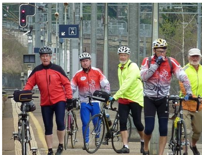
5 cyclos décidés et prêts à affronter une tête de veau

Voulant éviter un déplacement sur Lyon, j'ai pris ma voiture, et à la sortie je regrette mon choix, j'aurais dû partir par le train.